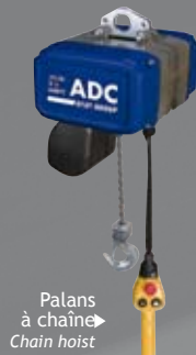
Palans à chaîne Chain hoist

Consisting of cold rolled sections and simple and modular accessories, our crane systems are light, silent to run, cost effective and simple to install. They can be easily converted or extended to adapt to your future needs. The maximum lifting capacity is 2t. The operation can be manual or electrical.